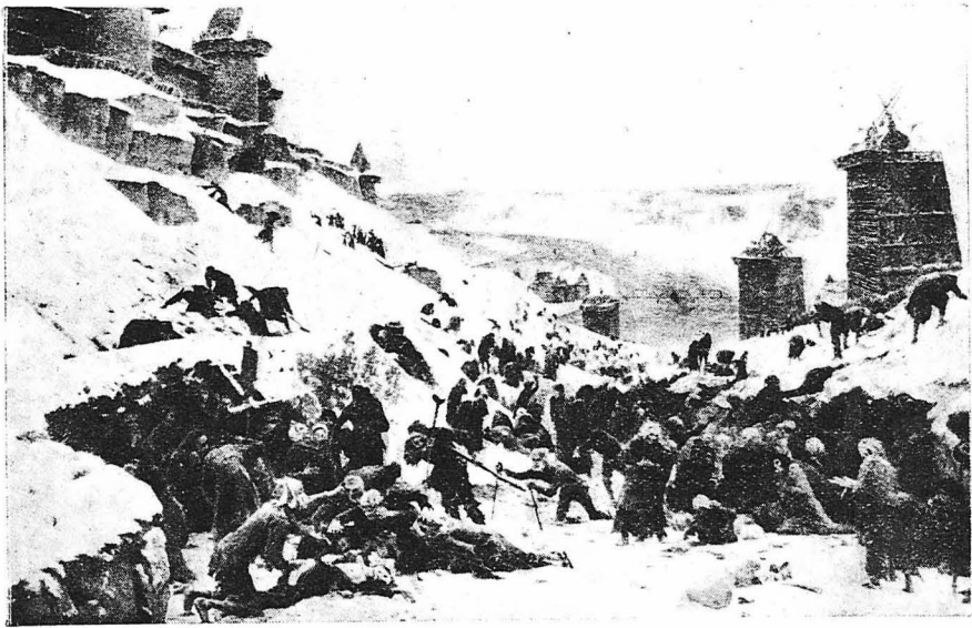
ΤΑ ΑΧΡΗΤΑ ΣΤΟΜΑΤΑ. — ΕΠΕΙΣΟΔΙΟ ΑΠΟ ΤΗΝ ΠΟΛΙΟΡΚΙΑ ΤΟΥ ΣΑΤΩ ΓΚΑΓΙΑΡ ΤΟΥ 1802. Πίνας του Ταττενχάιν, ζωγράφου της εποχής.

Έτσι είμαστε έξασφαλισμένοι ότι δεν θ' άντικρύσουμε και πάλι τις μεγάλες αυτές καταστροφές, των όποιων και μόνο ή άνίμνησις μās προκαλεί φρίκη. Παντού όπου άπλώθηκε ο πολιτισμός, δεν ύπάρχει πιά φόβος να επαναληφθή το τρομερό αυτό γεγονός: μιά χώρα να μη μισρή να θρέψη τους κατοίκους της. Ύπάρχουν σήμερα έκατομμύρια όλοκληρα άνθρώπων που δεν έχουν να φορηΐν την πείνα για το μέλλον. Εΐταν ένα κακό όνειρο και διαλύθηκε!