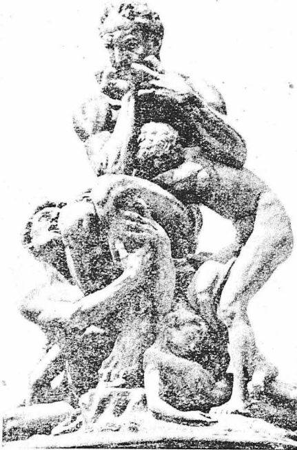
Ο ΟΥΓΚΟΛΙΝΟΣ ΚΑΙ ΤΑ ΠΑΙΔΙΑ ΤΟΥ ΜΕΣΑ ΣΤΟΝ «ΠΥΡΓΟ ΤΗΣ ΠΕΙΝΑΣ». Γλυπτικό σύμπλεγμα του Καρλο.

Ο Λάντσερ στην «Κόλαση» του περιγράφει το μαρτύριο του κομνηνού Ουγκολίνου, ο οποίος είχε καταδικασθεί εις τὸν ἐκ πείνης θάνατο. Τὸν βλάσαν μέσα σ' ἕνα πύργο. Ἐκεῖ πρὶν πεθᾶναι ὁ Ουγκολίνος ἄρχισε νὰ τροφῆ τὰ παιδιὰ του.