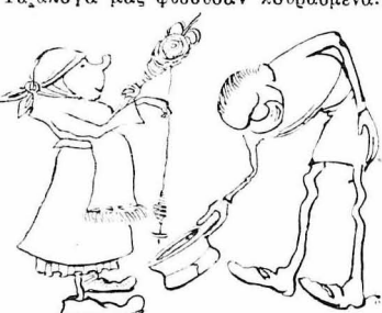
Τη στάσι μας άπέναντι των χωρικῶν.

Και σ’ ότο καθ’ έξής. ‘Ο Δεσπότης σταμάτησε λίγο τη διήγησί του. Τώρα άρχισαμε ν’ ανεβαίνουμε τα δύσβατα, ανηφορικά βουνά. Τα δ’ αλογά μας φυσούσαν κουρασμένα.