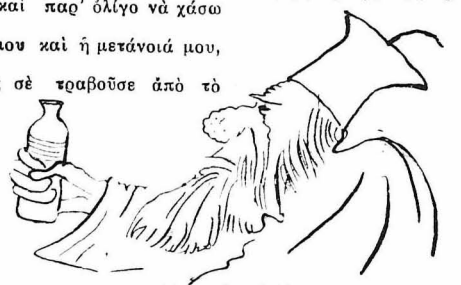
— Λίγο για τη ζέστη.