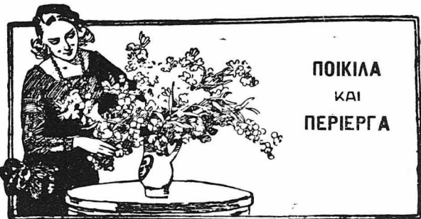
ΠΟΙΚΙΛΑ ΚΑΙ ΠΕΡΙΕΡΓΑ

Ο μπάρμπα Φώτης δέν έλεγε ποτέ όχι. Στέφ. Δάφνης