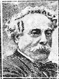
Ἀλέξανδρος Δουμάς, πατὴρ καὶ υἱός.