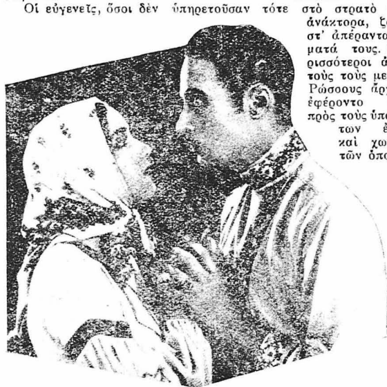
Οἱ δύο νέοι εἶχαν ἀγαπηθεῖ.

ζωὴ εἶχε συνδεθεῖ στενά μὲ τὴν ζωὴ τῶν κυρίων τῶν. Χάρις σ' αὐτὴ τὴν οἰκειότητα, ἓνα σωρὸ εἰδιύλλια γεννιάντουσαν μεταξὺ τῶν νέων τῶν δύο τάξεων, τὰ ὁποῖα κατέληγαν σὲ δράματα ὅταν οἱ ἔρωτευμένοι ἀντίκρουζαν τὴν κοινωνικὴ ἄβυσσο πού τοὺς ἐχώριζε καὶ τὸ ἐπραγματοποίητο τῆς ἐνώσεώς τῶν. Αὐτὸ ἀκριβῶς φοβήθηκε καὶ ἡ πριγκίπισσα Νεκλούντοφ, τὴν ἡμέρα πού ὁ ἀνεψιὸς της, ὁ πρίγκιψ Ντιμίτρι, ἔφτασε στὸ ἀπέραντο ὑποστατικὸ της, γιὰ νὰ περάσῃ ἐκεῖ δύο μῆνες τοῦ καλοκαιριοῦ.