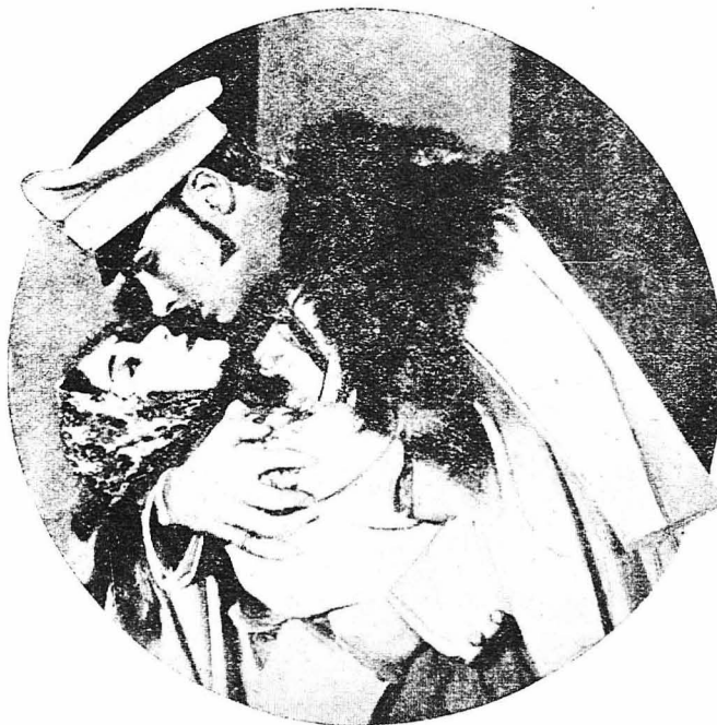
'Ο ώραιος Ντιμίτρι έορξισε στην άγκαλιά του την Κατούσα.

βράδυ και τόν περίμενε. 'Αλλοίμονο όμως ! Βρήκε τó Ντιμίτρι μεθυσιμένο μεταξύ δύο γυναικών. Κ' έτσι τó τραίνο ξαναφύγε χωρίς ό Ντιμίτρι ν' άναγνωρίση τή δυστυχισμένη Κατούσα.