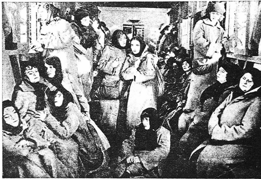
Ἡ Κατούσα εἶχε γίνε πιά μὴ ἀπὸ τὶς γυναῖκες πού περιφρονεῖ ἡ Κοινωνία καὶ τὸ Δικαστήριον τὴν εἶχε καταδικάσει σὲ τσεσάρων ἐτῶν καταναγκαστικὰ ἔργα στὴ Σιβηρία.

Ἡ πριγκίπισσα Νεκλούντοφ, ἡ ὁποία περιμένε τὸν ἀνεψιὸν της στὴν ἐξώπορτα, μάζεψε ἑλαφρὰ τὰ φρούδια της βλέποντας τὸ διάβημα τοῦ ἀνεψιοῦ της