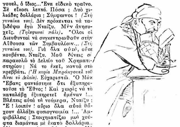
Ἄλλο !... Ἄλλο !... Πῶς πάνε ἡ μετοχές ...

Ἄλλο ! Ἄλλο ! Πῶς πάνε ἡ μετοχές τῆς 'Εθνικῆς Τραπεζῆς ; Πάντα σταθερές ; Καλὰ ! Πουλήσετε... Τί ; Σιγά—σιγά στὴν ἀρχὴ—καὶ στὸ κλεισίμο μεγάλως ποσότητες—δὲς μπορεῖτε... (Κλείνει τὴ γραμμὴ κα' ἀμέσως παίρνει ἄλλη). Ἄλλο ! Τὰ Γραφεῖα τῶν Σιδηροδρόμων ; ... Ναί... Ὁ Μπρόκ-