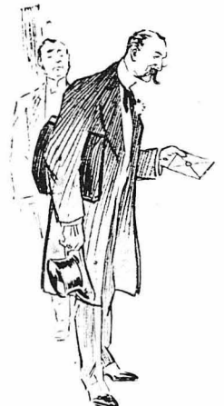
Καβάστε αὐτὸ κύριε...

ΜΠΡΟΚΓΟΥΕΛ. — Δέν σᾶς τὸ ἐπιτρέπω. "Ό Βασιλεὺς τοῦ χαλκοῦ ἀξίζει ὅσο κ' ἕνας Πρόεδρος. Τὸ κράτος δέν εἶνε παρὰ μιὰ ἐννοια ἀφρημένη ἐνῶ ἡ ἐπιχειρήσεις μου εἶνε πραγματικῆς. "Αν χαθῶ, τὸ πᾶν καταστρέφεται. Διευθύνω τὸ τράστ τοῦ χαλκοῦ, τῶν νοσηρῶν, τῶν ραπτομηχανῶν. "Ασφαλῶς διακόσιες χιλιάδες ἐργάτες καὶ ὑπαλλήλους. Πεντακόσιοι σπουδαῖοι οἴκοι κρέμονται