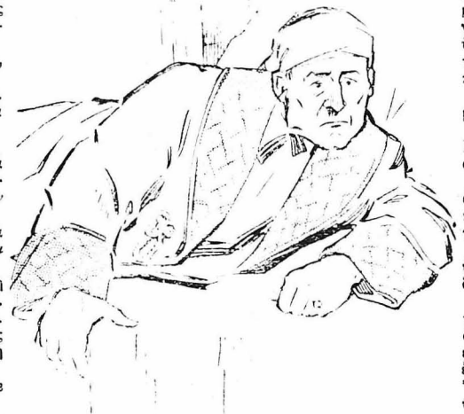
Τί εἶπατε; Ἡ ἀπόπειρα δέν ἔχει ἀκόμα γνωσθῆ ;...