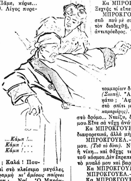
...Κάμπ !... Κάμπ !... Κάμπ !...

Κα ΜΠΡΟΚΓΟΥΕΛ.— Κι' ἂν τὸ νέο διαδιδόταν ; Ὅλες σου