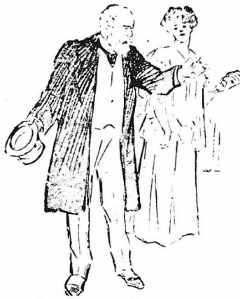
Σας διατάσσω ν' αναπαυθήτε...

χαρτί που είχε μές' στο συρτάρι του γραφείου. (Η Κα Μπρόκγουελ τὸ παίρνει). Διάβασε.