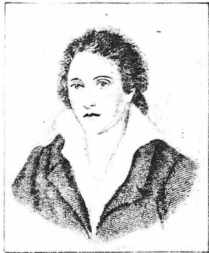
Ὁ μεγάλος Ἄγγλος ποιητῆς ΣΕΛΙΕ'Υ