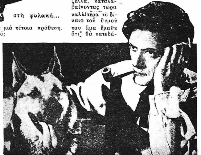
‘Ο Φραντζέσκος εἶχε ἀχώριστο σύντροφο ἕνα ὑπέροχο σκυλί.

— Τι γενναία καρδιά ! σέφτηκε ἡ Γκιζέλλα, καταλαβαίνοντας τώρα καλλιτέρα τὸ δίκαιο τοῦ θυμοῦ τοῦ ἡμα ἔμαθε ὅτι θὰ κατεδά-