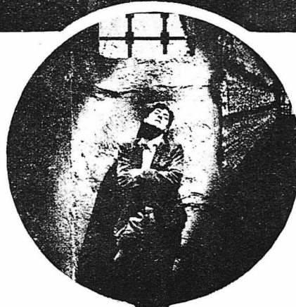
‘Ονειρευόταν στὴ φυλακὴ...

— Ποτὲ δὲν εἶχαμε μιὰ τέτοια πρόθεση. Ποιὸς σὰς τὸ εἶπε αὐτό;