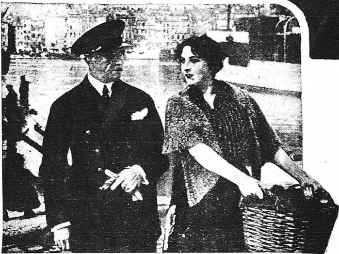
Ο ξένος γοητεύθηκε από την όμορφιά της Μαντελόν.

Ένα ύπερβύχιο που περνούσε από και τὸν περισυνέλεξε. Κυβερνήτης τὸν ύπερβύχιου ήταν ο Ζάν ντε Τρεγκόρ, ο όποιος δ- τὸν έμαθε από τὸ στόμα τὸν Ρασκάς ότι η μνηστή του βρισκόταν στα χέρια της Μαν-