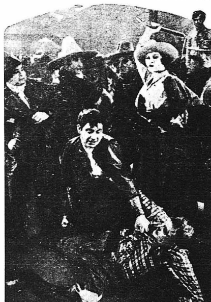
Η Μαντελόν ύψωσε τὸ μασιγιό της.

Ο πάνθηρ αυτός είχε φύγει από ένα καράβι άγκυροβολημένο στην παραλία και η νέα που ήταν Ζερμαίν Ντελαρός ήταν κόρη ενός μεγαλεμπόρου ποτῶν, που περνούσε τυχαίως από και ύπστη την επί-