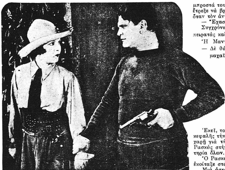
Ο Ρασκάς της έπιασε τὸ χέρι, ἐνῶ συγχρόνως τραβούσε τὸ πιστόλι του.

τελόν, ἀπεφάσισε μὲ κάθε θυσία νὰ τὴ σώσει.