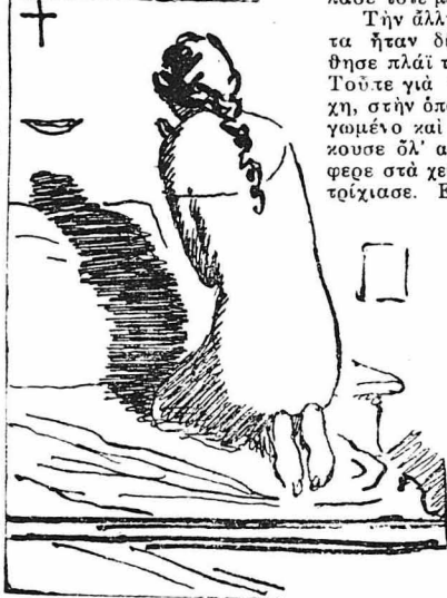
Γονάτισε και προσευχήθῃ στὸ Θεό.

Όχι! ὄχι! Δέν έπρεπε νὰ ξαναγυρίσῃ ποτέ κοντὰ σ' εκείνην,