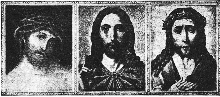
Ο Ίησους Χριστός όπως τον παρουσιάζουν εις τους πίνακας των οί Φλαμανδοί και Γερμανοί ζωγράφοι του 15ου αιώνος Κράναχ, Μασούς και Βάν ντε Βάιντεν.

φθιστά 1353 στην εκκλησία του Λιραι στην Καμπανία. Προσθέτουν ότι το έπληξαν εκεί και το αφιέρωσαν σταυροφόροι, ιερών λάφυρον των εσπερατειών των στους άγιους τόπους. Άλλά μιá σοβαρή ιστορική έρευνα του κ. Ζοζέφ ντε Τέιλ στα 1902 απέκάλυψε με ανακρίβειαν επιστημονική στην έταιρεία των αρχαιολόγων της Γαλλίας, ότι το Άγιο Σουδάριο του Τουρίνου, όπως εξηκριβώθη από παλιά χρονικά ευρίσκετο κατατεθειμένο το 1203 στην Άγία Μαρία των Βλαγγρινών της Κωνσταντινουπόλεως, ως δισώων την πραγματική φυσιογνωμία του Σωτήρος. Άπό τότε είχε γεννηθεί ζήτημα αν ήτο γνησία άποτύπωση της μορφής ή ήτο έργο τεχνητό.