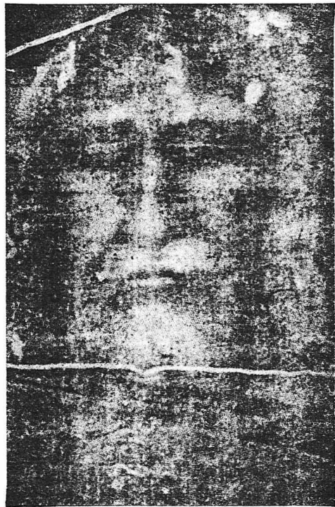
Τό πρόσωπον του Χριστού νεκρού όπως έχει άποτυπωθεί εις το Άγιον Σουδάριο, τό ευρισκόμενον εις το Τουρίνον, και τό όποϊον υποτίθεται ότι είνε το πραγματικόν σάβανον του μαρτυρήσαντος επί του σταυρού.

Δέν μένει λοιπόν πλέον καμμία άμφιβολία, ότι πρόκειται περί γνησίας άποτυπώσεως ανθρώπινου σώματος. Το μόνον άνεξακρίβωτον είνε αν έπρό-