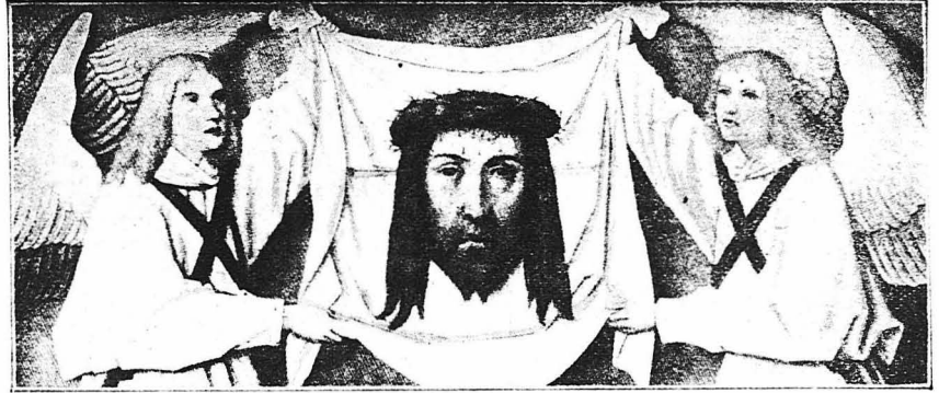
Ἡ Ἁγία Μορφή ὅπως εἶνε ἀποτυπωμένη εἰς τὸ μαδηλίον τῆς Ἁγίας Βερενίκης, εἰκὼν τοῦ Τζάιμπλου Γερμανοῦ ζωγράφου τοῦ 16ου αἰώνου.

Τὸ μυστήριον τῆς μορφῆς τοῦ Σωτῆρος. Κανεὶς ζωγράφος σύγχρονος τοῦ δὲν ἔκαμε τὴν εἰκόνα τοῦ. Τὸ χερί τοῦ Ντα Βίντσι ὅταν ἐξωγράφισε τὸ κεφάλιν τοῦ Χριστοῦ ἔτρεψε. Τὸ ἅγιον Σουδάριον τοῦ Τουρίνου εὐρίσκατο στὴν Κωνσταντινούπολιν στὰ 1203. Πῶς ἐφθάσε στὴ Γαλιλία. Αἱ ἐπιστημονικαὶ ἐρευναι. Δὲν εἶνε ἔργον ζωγραφικῆς—Εἶνε ἀποτύπωμα γνήσιον ἀνθρώπινον σώματος, κλπ.