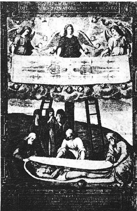
Πῶς ἐσαβανώθη καὶ ἐτάφη ὁ Χριστὸς κατὰ τὴν εἰκόνα τοῦ Τζούλιο Κλόβιο κατὰ τὸν 16ον αἰῶνα. Οἱ ἄγγελοι τῆς εἰκόνας κρατοῦν τὸ ἅγιον Σουδάριον τοῦ Τουρίνου.

εἶνε Γερμανός, καθὼς ὁ Χριστὸς τοῦ Κορρέτζιο εἶνε ἕνας ὁμοίωτος μεσημβρινός. Καὶ βέβαια ἂν ἀναζοῦσε κανεὶς ἀπὸ τοὺς πρώτους χριστιανούς ποὺ εἶχαν φτάσει στὴ Ῥώμην ἀπὸ τὴν Ἰουδαίαν καὶ ἐξοῦσαν στίς κατακόμβαις τῆς αἰωνίας πόλεως, καὶ ἂν ἔμπαινε ἐξάφνου στὰ μουσεῖα τὰ πλημμυρισμένα ἀπὸ εἰκόνας τοῦ Χριστοῦ δὲν θ' ἀνεγνώριζε κανένα ὡς εἰκόνα τοῦ σταυρωθέντος ἐπὶ τοῦ Γολγοθά.