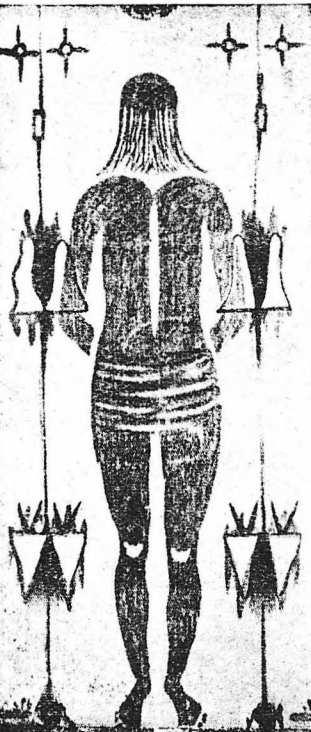
Η άποτύπωση του σώματος του Ίησού Χριστού εκ των όπισθεν όπως διατηρείται επί του Άγιου Σουδαρίου.

Κερπίνης, της Ζακύνθου. Προόκειται περί άλλου σουδαρίου ή του ίδιου του Τουρίνου; Όπωςδήποτε εκείνη που το έπληξε μαζί της στη Γαλλία για να το εξασφαλίση μιá μεγάλη κυρία ή Μαγαρίττα ντε Σαρνύ, που κληρονομήσε από μιá πριγκίπισσα της Ιερουσαλήμ και των Έκτορα Λουσινιάν της Κύπρου, ευρίσκετο πού του 1353 στην Ελλάδα.