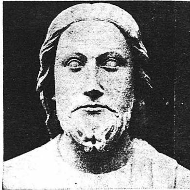
Κεφάλιν τοῦ Χριστοῦ καμωμένη τὸν 13ον αἰῶνα.

Λένε πῶς τὸ χερί τοῦ Λεονάρδου ντὰ Βίντσι, ὅταν ἐξωγράφισε τὸ πρόσωπον τοῦ Χριστοῦ ἔτρεψε πάντοτε. Καὶ ὅταν ὁ μεγάλος αὐτὸς ζωγράφος ποὺ ἔκαμε τὰ θεότερα κεφάλια Χριστοῦ, ἐτελείωσε τὸν περίφημον «Μυστικὸν Δεῖπνον» τοῦ εἶπε στὸ φίλον τοῦ τὸν δούκα Λουδοβίκου Σφόρτσα,