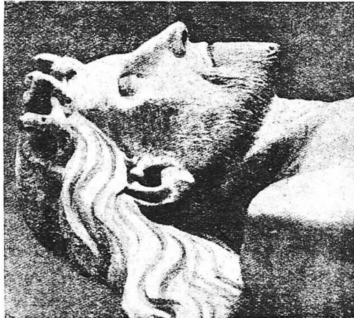
Θαυμασία κεφαλή του Χριστού νεκρού κατά γλυπτικόν έργο του ένδεκάτου αιώνος

Ένας από τους φράγκους κατακτητάς της Κωνσταντινουπόλεως έληξε το Σουδάριο από την εκκλησία των Βλαγγρινών και βρούσκουμε από έγγραφα κληρονομικά και άλλα ιστορικά δοκοιμένα ότι το ιερό αυτό χειμάλιο έπέρασε άργότερα ως ιδιοκτησία διαφόρων Φράγκων άρχόντων των Άθηνων, της Βοστανίας,