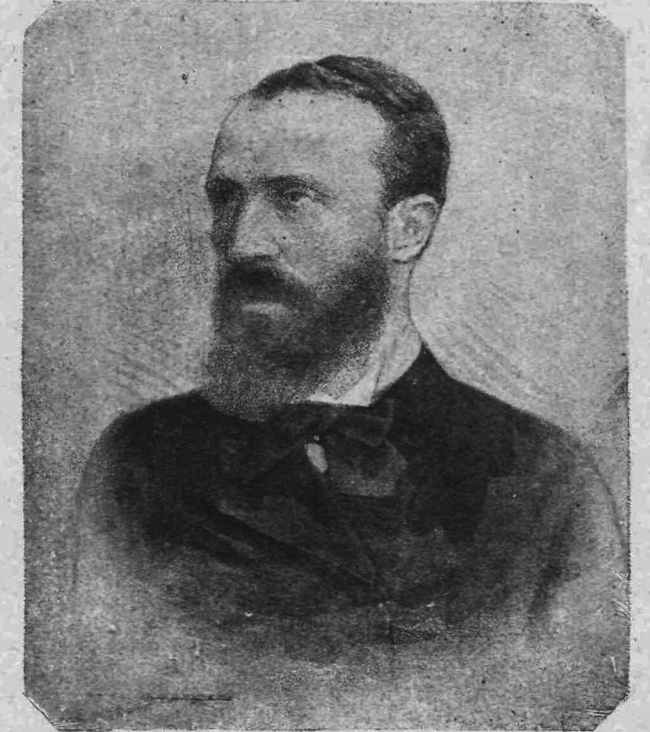
ΛΕΩΝΙΔΑΣ ΛΕΑΝΔΡΟΣ (Υπουργός ἐπὶ τῶν Ἐξωτερικῶν)