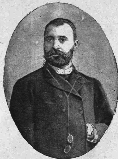
ΑΧΙΛΛΕΥΣ ΓΕΡΟΚΩΣΤΟΠΟΥΛΟΣ (Υπουργός ἐπὶ τῶν Ἐκκλ. καὶ τῆς Παιδείας)