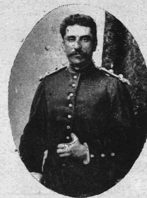
ΚΩΝΣΤΑΝΤΙΝΟΣ ΚΟΥΜΟΥΝΔΟΥΡΟΣ (Υπουργός ἐπὶ τῶν Ναυτικῶν)