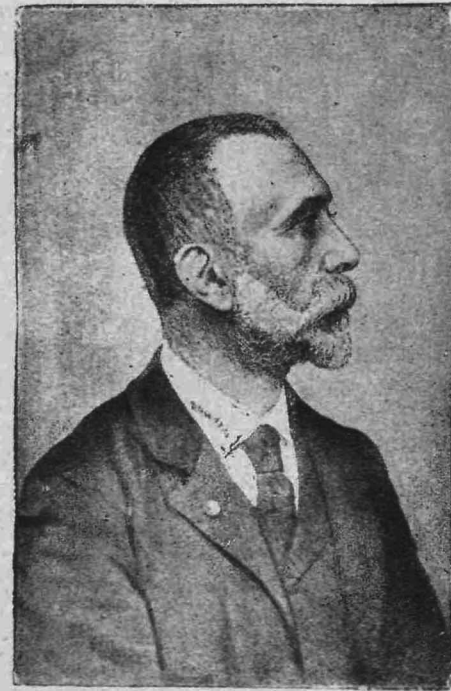
ΚΩΝΣΤΑΝΤΙΝΟΣ ΚΑΡΑΠΑΝΟΣ (Υπουργός ἐπὶ τῶν Οἰκονομικῶν)