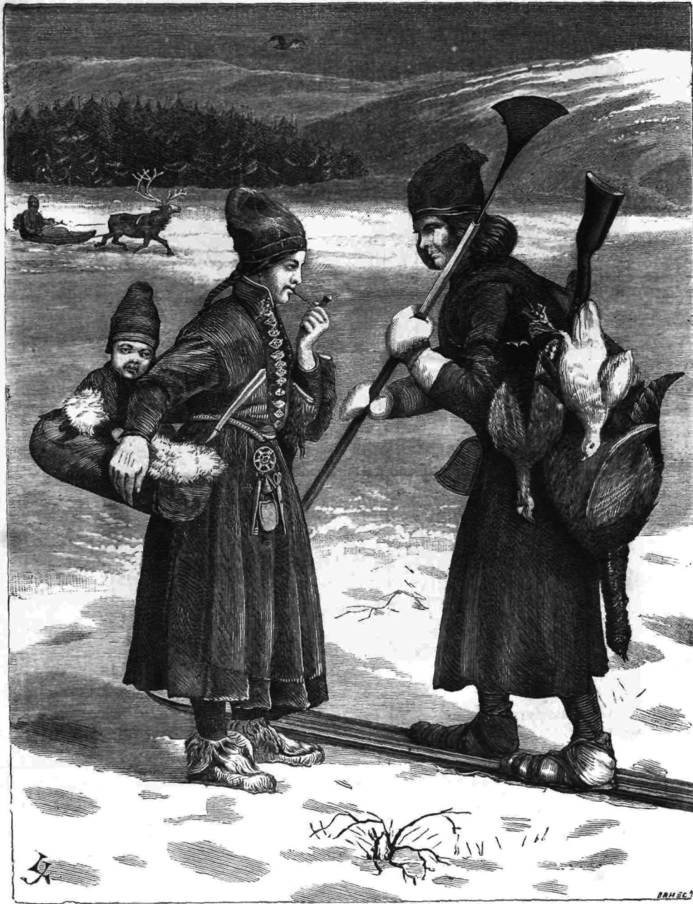
ἨΘΗ ΚΑΙ ΕΘΙΜΑ — ΚΑΤΟΙΚΟΙ ΛΑΠΩΝΙΑΣ (Ἰδε σελ. 159.)

(τύπτει τὸ πτώμα) Βλέπεις; ὅταν τὴν ψυχὴν Τὴν μᾶλλον ἠρεμοῦσαν ἢ ἐκδικησὶς Ὡθήσῃ, δὲν κοιμᾶται πλέον τίποτε