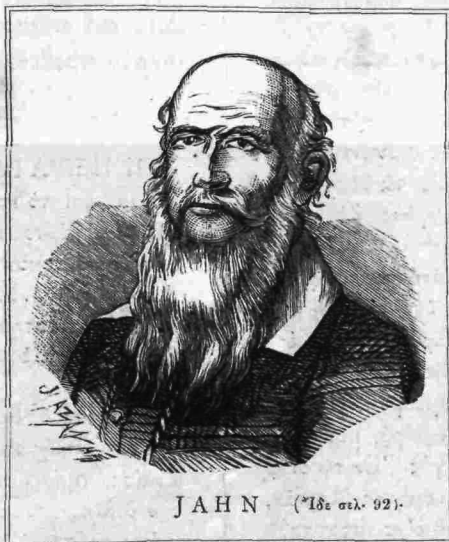
JAHN (Ἰδε σελ. 92).

θέντος κόμητος. Μετὰ ταῦτα ἀπεχαιρέτησε τὴν σύζυγόν του καὶ ἀπῆλθεν εἰς τὸ στρατόπεδον, ἀλλὰ μόλις εἶχε προχωρήσει βήματά τινα τῆς οἰκίας του, καὶ ἰδοὺ εἰσέρχεται κρύφα ὁ παρακολουθήσας αὐτὸν δολοφόνος καὶ δι' ἀπειλῶν ζητεῖ παρὰ τῆς Μαγδαληνῆς, τῆς συζύγου τοῦ λοχίου, τὸ κιβώτιον τῶν θησαυρῶν τοῦ κόμητος, ὃν δολίως ἐφόνευσεν· αὐτῇ ἀνθίσταται, κραυγάζει, αἱ δὲ κραυγαὶ τῆς ἐξυπνοῦσι τὸ πενταετὲς θυγάτριόν της, ὅπερ καὶ καθησυχάζει αὐτῇ, ἀναγκασθεῖσα ὑπὸ τοῦ κακούρ-