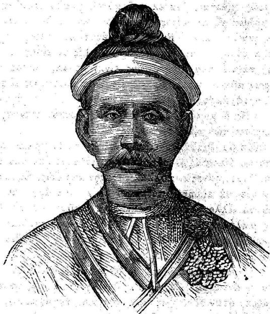
ΘΑΪΤ-Ο-ΣΧΕΕ , πρωθυπουργὸς τῆς Βιρμανίας.

Ὁ Σεκουκούνης λοιπὸν οὗτος, οἰαδὴποτε καὶ ἂν ᾗ ἡ καταγωγὴ του, διέπραττε πρὸ ἐτῶν ληστείας, φιλοξενῶν εἰς τὴν ἐξ ἀποτόμων βράχων περιζωσμένην πρωτεύουσαν αὐτοῦ συμμορίας ἀνθρώπων ἐξ ὅλων τῶν φυλῶν, αἵτινες προσήρχοντο εἰς αὐτὴν φεύγουσαι ἐνεκα ἐρίδος τοὺς πρότερον ἀρχηγούς των.