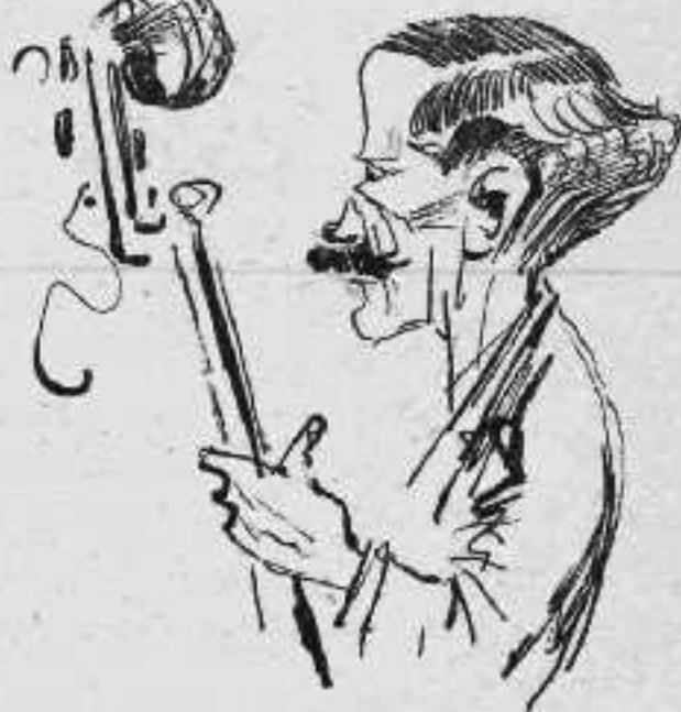
Τὸ φέλημα ἐν τῷ "Ἄνθρωπῳ τῶν Νυμφῶν."