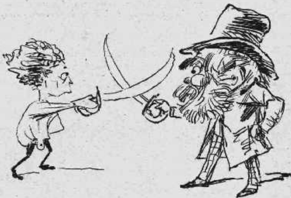
Νέα λύσις διαφορᾶς μεταξὺ διδασκάλου καὶ μαθητοῦ.