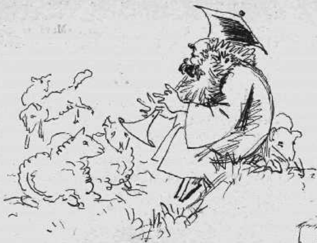
Ὁ ποιμὴν καὶ τὸ ποίμνιον ἐν Κορίνθῳ μετὰ τὴν ἐγκαθίδρυσιν τοῦ Μητροπολίτου.