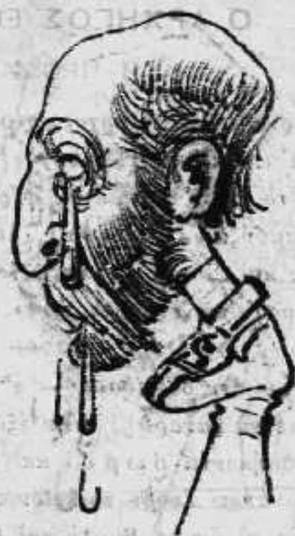
Καὶ ὁ Ρανιάρης τὸν Μεγαλόταυρο !!