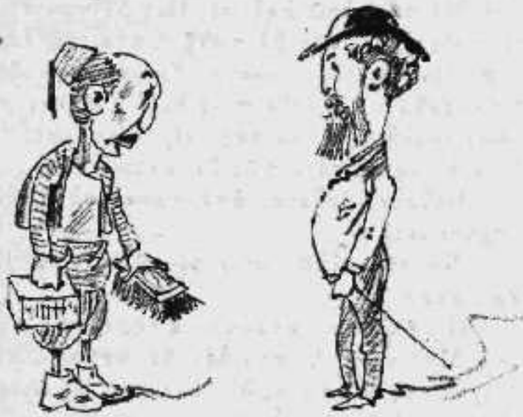
— Περσικαὶ προτάσεις διὰ τὸ γυάλισμα τῶν ὁδῶν εἰς ἀντίπραξιν τοῦ Φάμπρ.