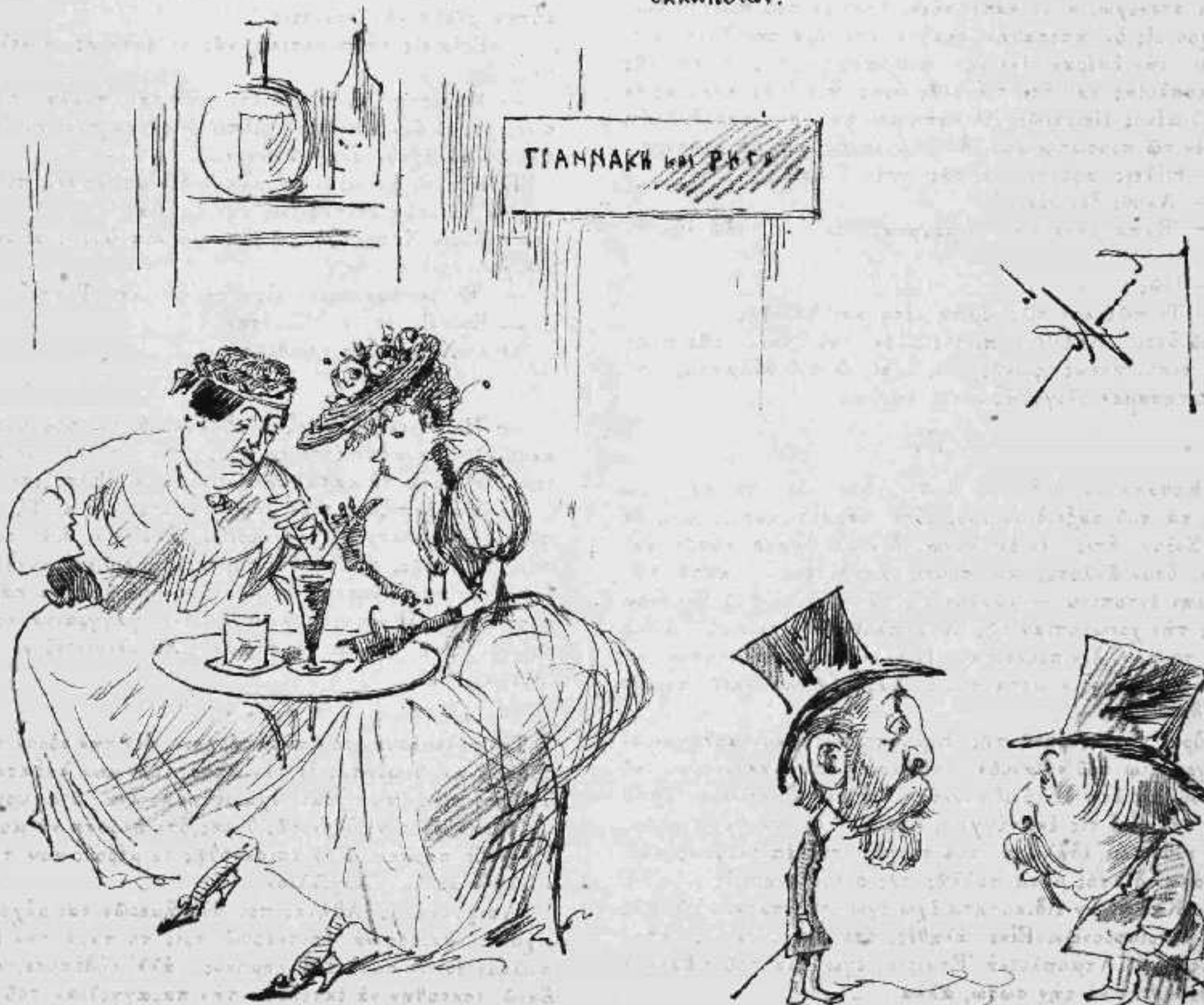
— Δροσιστικὴ οἰκονομία.