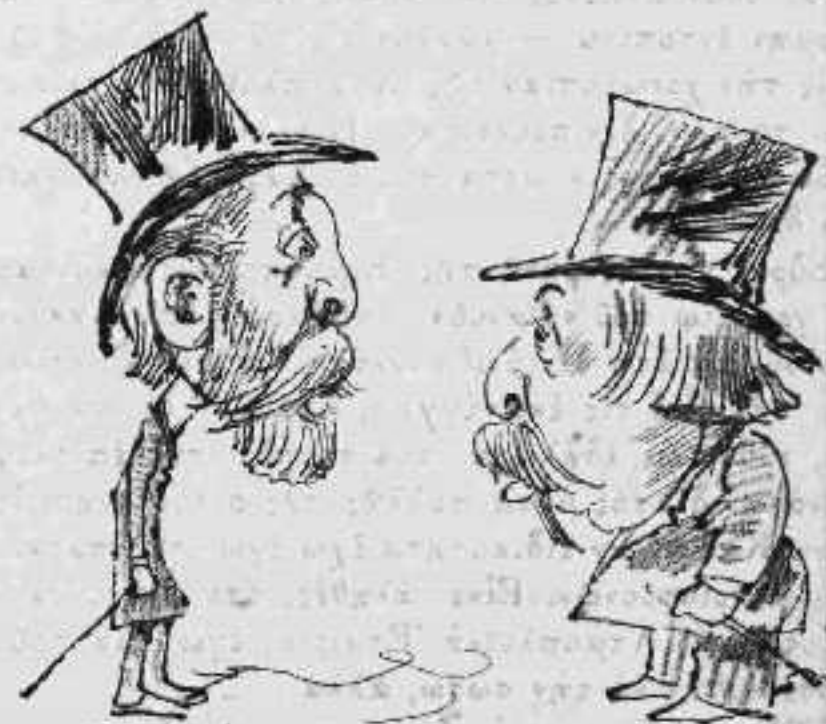
— Τί ἔξεύρετεν περὶ τῆς ἐκλείψεως τοῦ ἡλίου; — Ἡλίου φαεινότερον, ὅτι θὰ ἔχωμεν ἐκλογὰς.