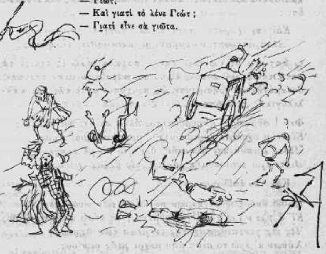
Καθημερινά από ρυτίρος θύματα.