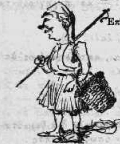
Συλλέκτης μύθων του λαού.