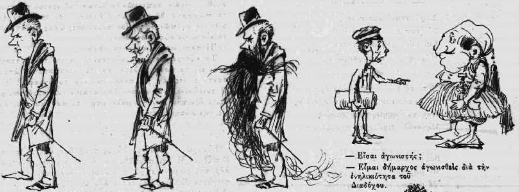
Ἐκτακτον φαινόμενον ἐξελίξεως.

— Εἶσαι ἀγωνιστής; — Εἶμαι δήμαρχος ἀγωνισθεὶς διὰ τὴν ἐνηλικιότητα τοῦ Διαδόχου.