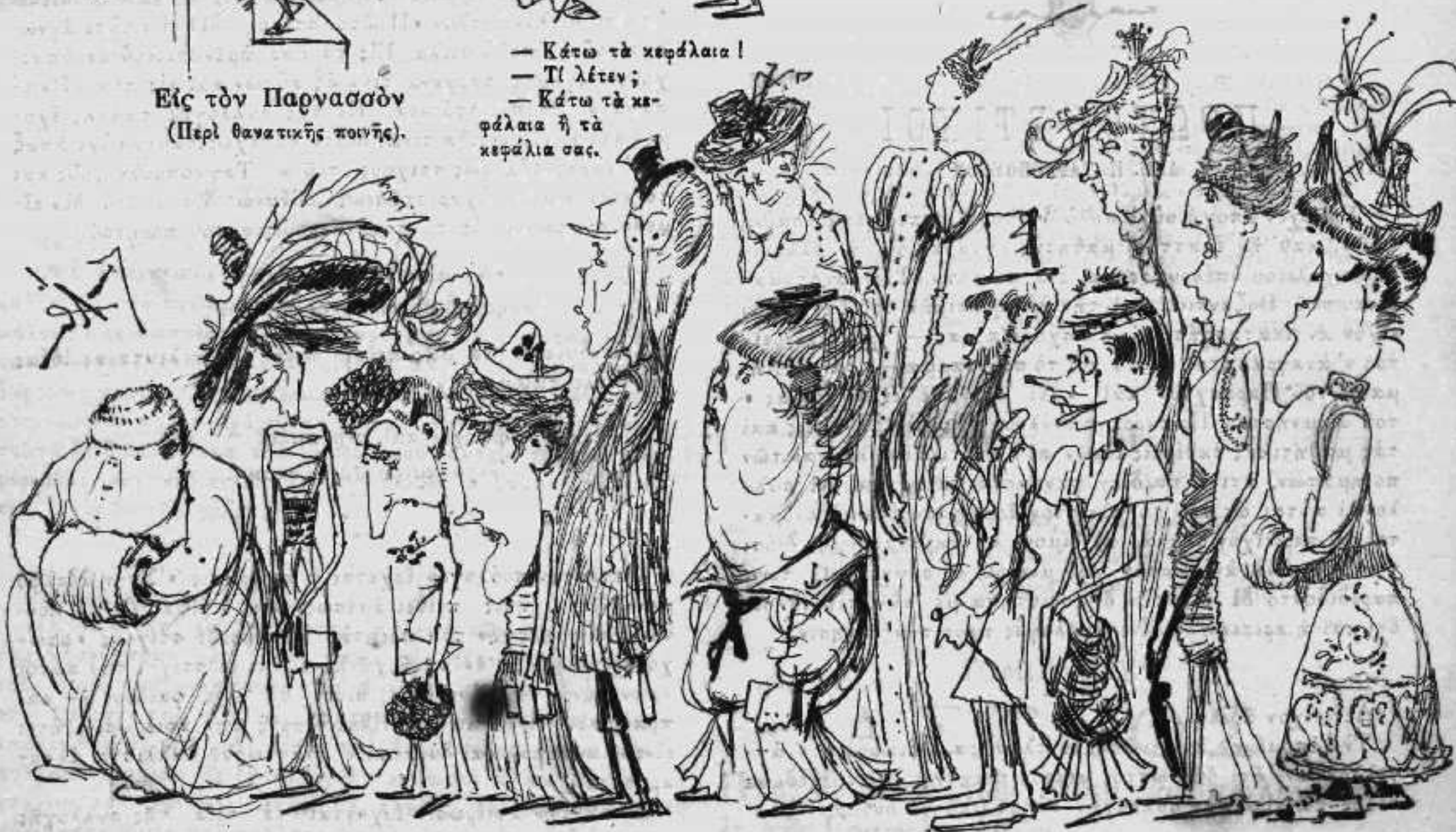
Ἡ ΕΞΟΔΟΣ ἐκ τῆς Ἀγγλικῆς Ἐκκλησίας κατὰ Κυριακὴν.