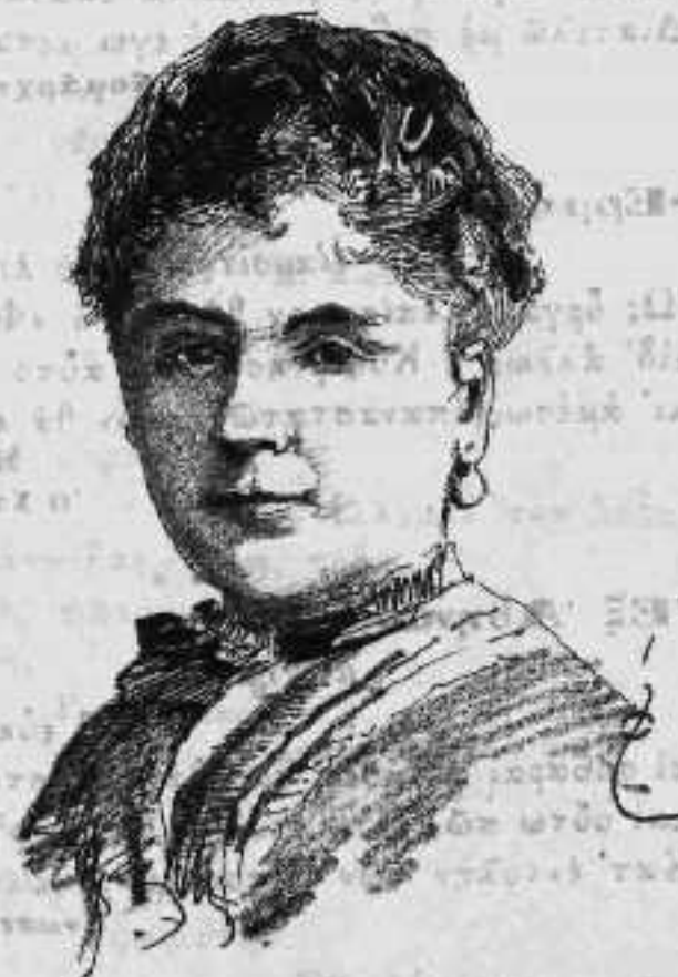
Gabrielle Bompard. (Πρό του εγκλήματος).