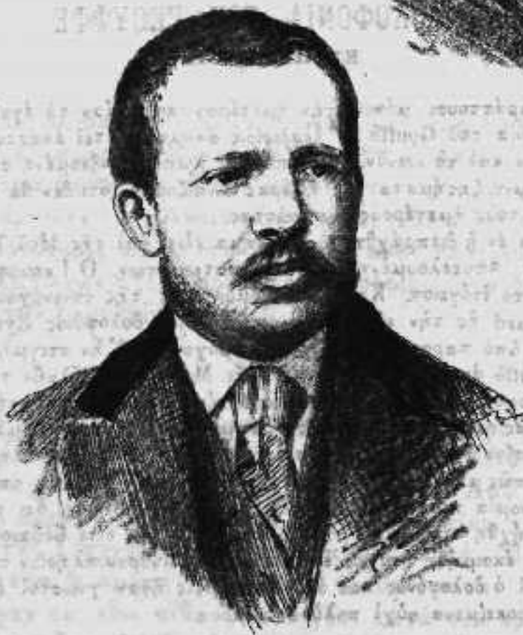
Ο δολοφόνος Eyraud.