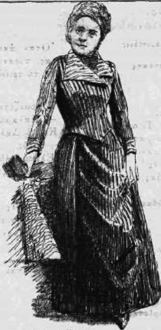
Gabrielle Bompard.