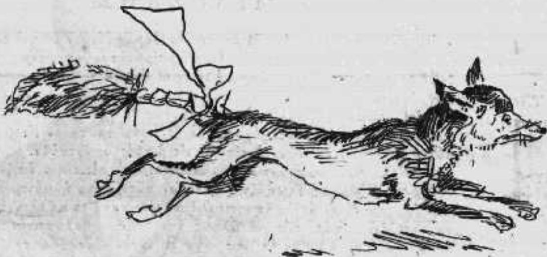
Μετὰ τὴν ἀπόδοσιν τῆς οὐρᾶς.