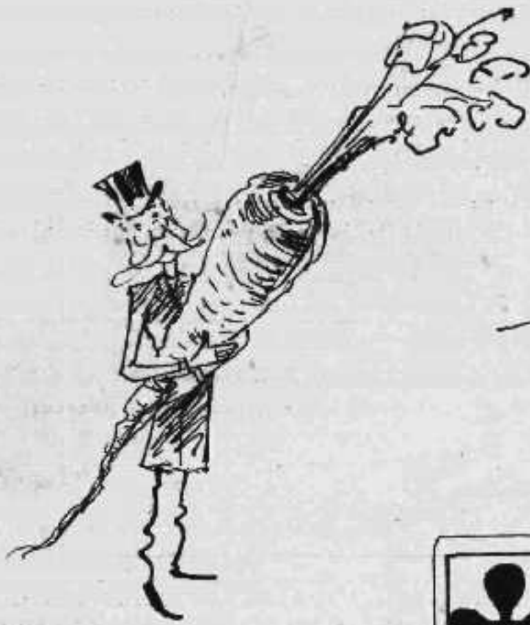
Ἐπιάσει τὸ Μάτι.