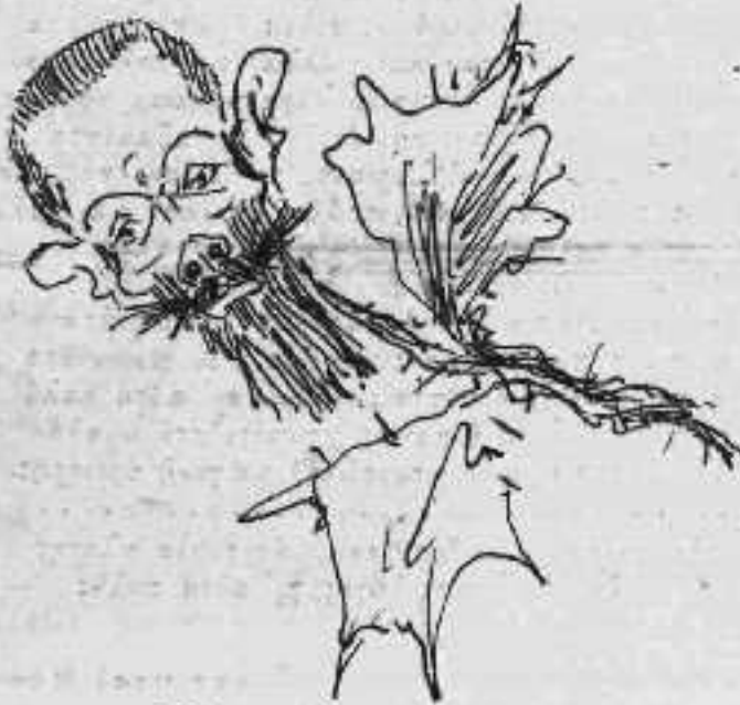
Φέεται εἰς τὰ Ὀλύμπια.