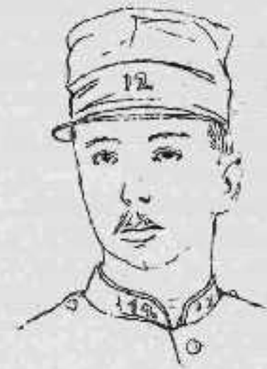
Ο ΥΠΟΛΟΧΑΓΟΣ ΒΑΓΚΕΝ