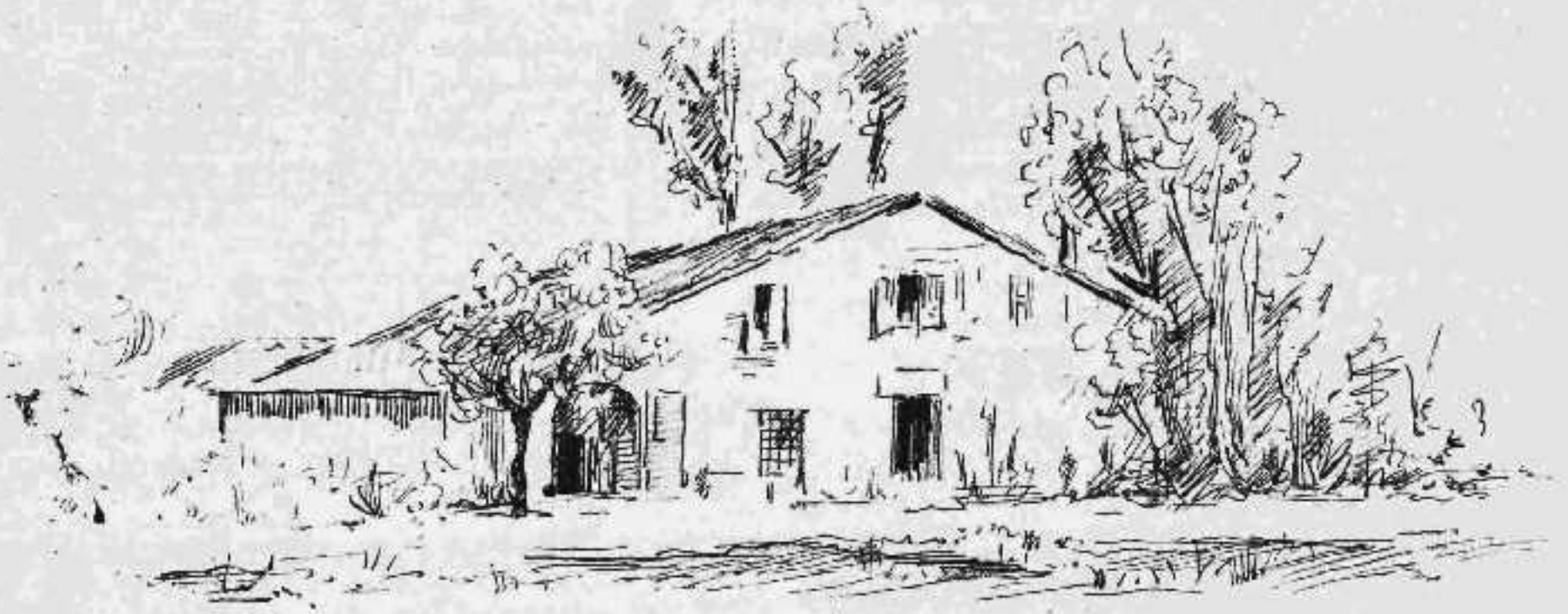
Ἡ οἰκία ἐν ἣ ἔγεννήθη ὁ Πέριος