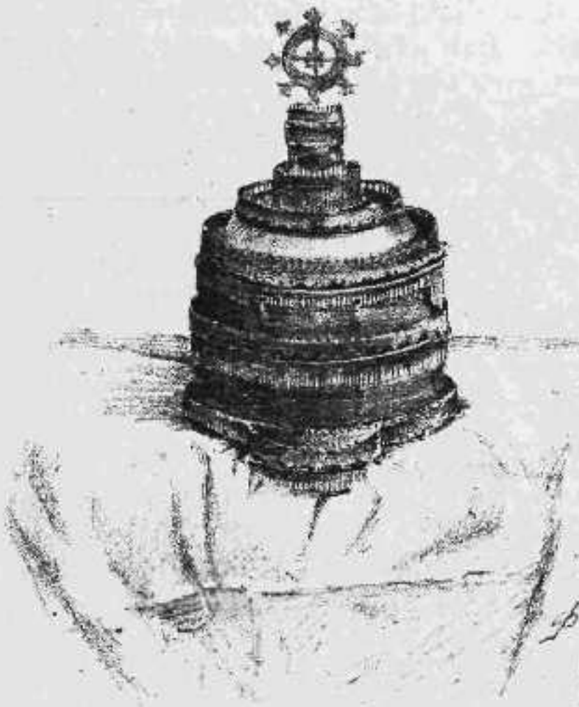
Τὸ στέμμα τῆς Ἀθυσσινίας

Ἡ ΒΑΣΙΛΕΙΑ ΤΟΥ ΤΕΛΕΥΤΑΙΟΥ ΣΥΡΜΟΥ ΚΑΙ ΤΟ ΚΡΑΤΟΣ ΤΗΣ ΦΙΛΟΚΑΛΙΑΣ ΔΙΑ ΠΙΛΟΥΣ ΓΥΝΑΙΚΕΙΟΥΣ ΕΥΡΙΣΚΕΤΑΙ ΕΝ ΤΩ ΚΑΤΑΣΤΗΜΑΤΙ ΤΟΥ