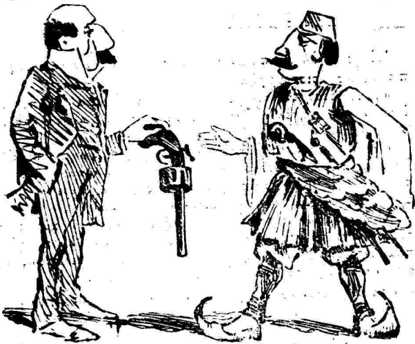
"Η τὴν ἴ, ἐπὶ τὴν.