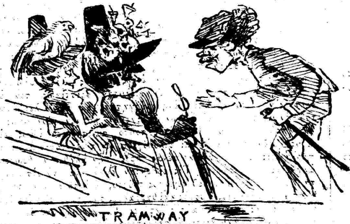
—Νὰ πᾶτε στὰ κλειστὰ.