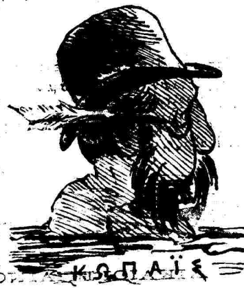
ΚΑΡΑΪΣ Ὁ Μινώταυρος ἀνακτῶν ἐνάμεις.