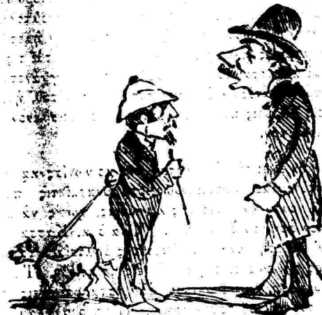
Δύο ἀπάραιτοι Νουάρχαι ἐὰν ἐκυβέρνα ὁ Χαρίλαος.