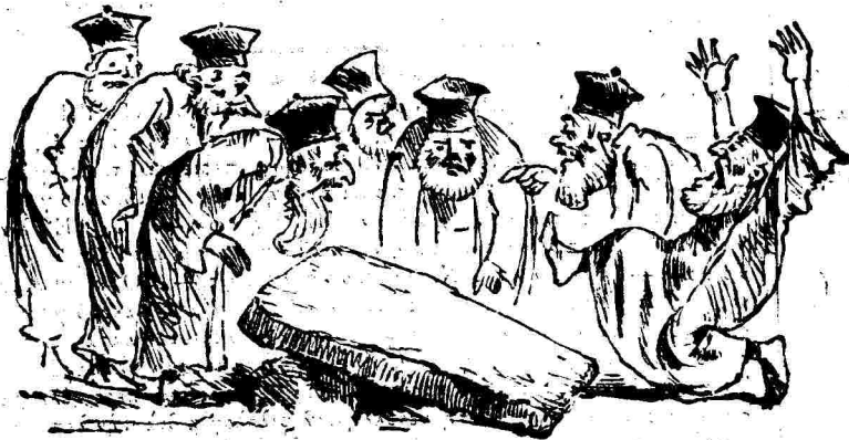
Ἡ ἀναγνώρισις τοῦ ἐν Κανᾷ τῆς Παλαιᾶς Δίῃ ὑπὸ τῆς Ἱερᾶς Συνόδου.