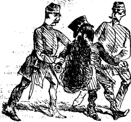
ΕΝ ΠΑΡΙΣΙΟΙΣ Μέσα!