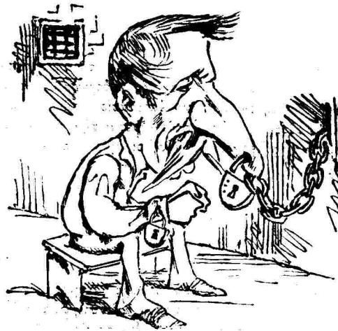
ΕΝ ΑΘΗΝΑΙΣ Κι' αυτός παραμέσα!!