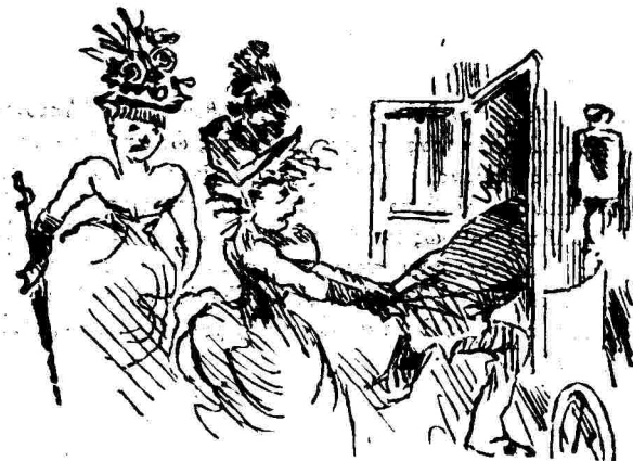
— Κύριε Διευθυντή, τὰ κλεισιά άμείξια είπες πώς είναι δικά μας.