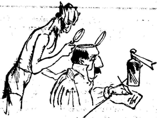
Δέν πάσχει τούς πόδας