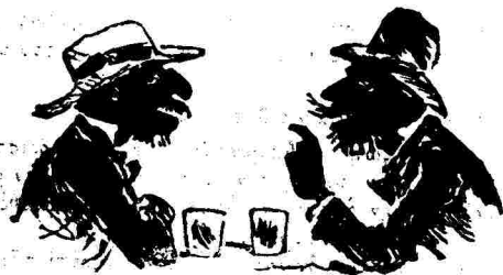
— Είδες μούτρα ο Μπογιατζόγλου να τὰ βγάινη και στην έφημερίδες! — "Ο,τι και να γράψη δέν περνάει ή μπογιατιά του.