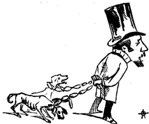
80 λεπτὰ ἢ ὀκτὰ τὸ κρέας... Ἦλθεν ἡ ἐποχὴ ποῦ δένουν τὰ σκυλιὰ μὲ τὰ λουκάνικα

Ὁ καλὸς πρωθυπουργὸς μας ἀπὸ τότε τᾶ χει χάσει Καὶ γυρίζει ὁ καῦμένος σὰν τρελλὸς μέσα ἔς τὴν πλάσι Καὶ γιὰ ναύρη τὰ χαμένα — ὅπως κάνει τακτικά— Νέον δάνειον ἐκδίδει καὶ γυρεύει δανεικά.