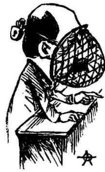
Μέτρα προφυλακτικὰ κατὰ τῆς ὑδροφοβίας