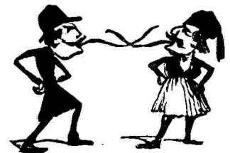
Πρωτοφανὴς μονομαχία ψαλτῶν.