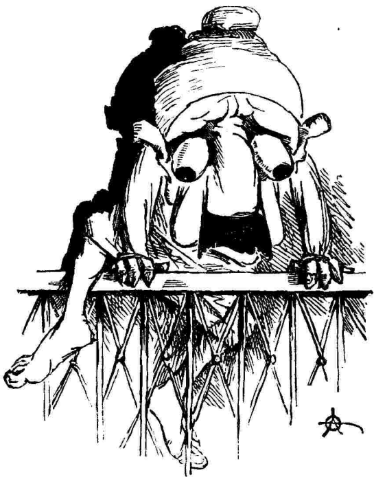
Μετά τήν ἔκρηξιν.