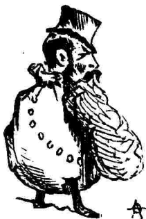
Τὸ χρυσοῦν τέρας.