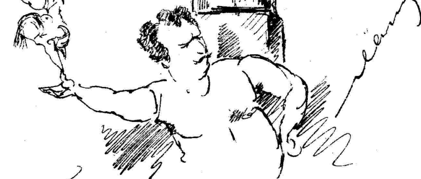
Τι δὲ ἴαμι ἐν τρίτῃ παραίσειον