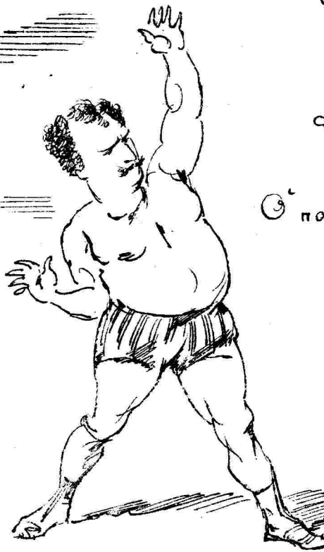
Εἰς τὰ ὄφθαλα