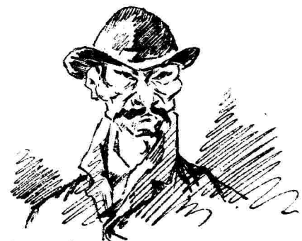
Ο Καταχωρησιὺ τῶν Πατρῶν