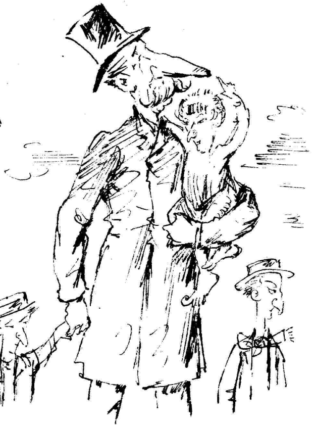
Με τρεις άρεψιοδες και τέσσερα έπουργεία