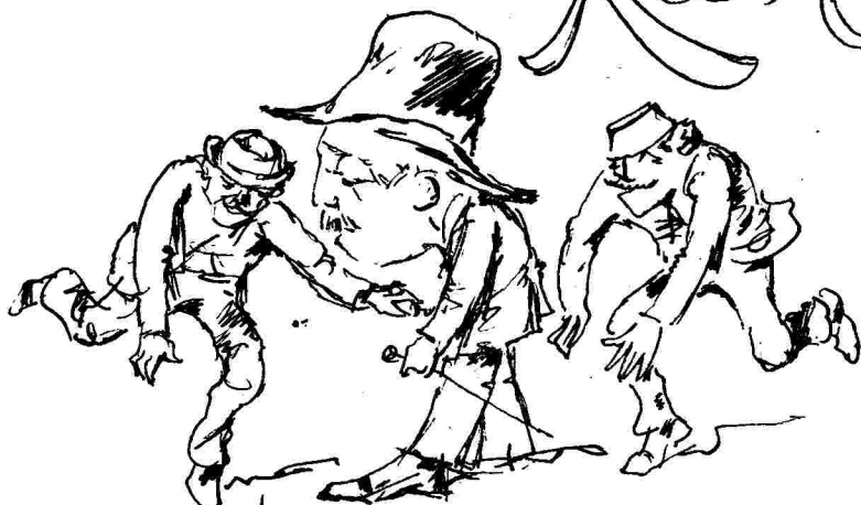
Διά τῆς μεθόδου τῶν δύο