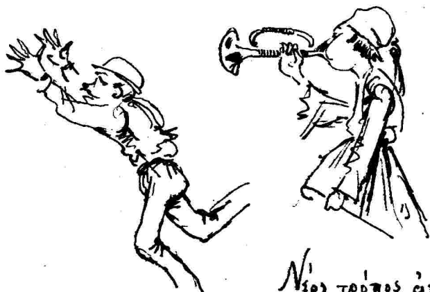
Νέος τρόπος ἀπεκκράθθ