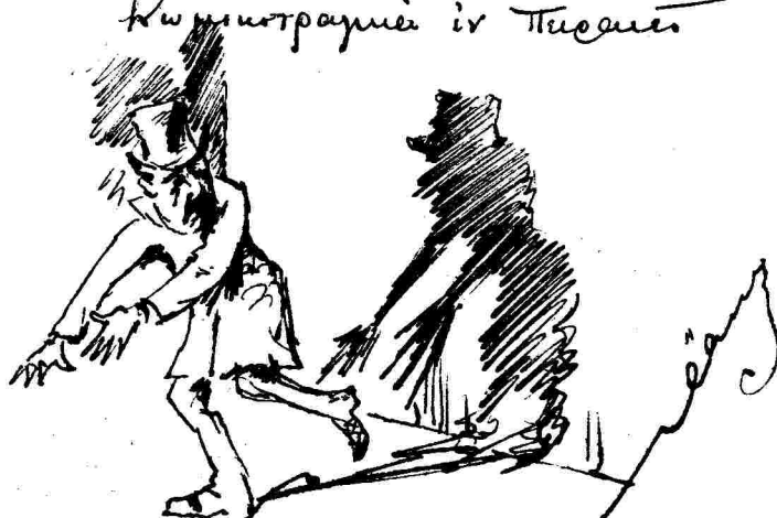
Ἀπὸ τῆς οὐαί τῶν!