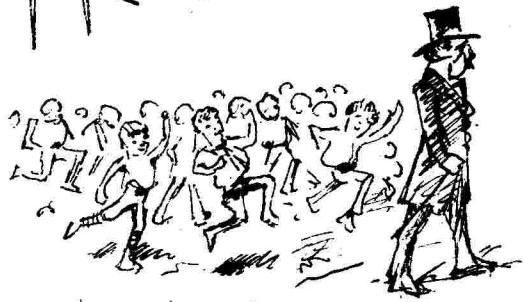
Ληστές και τρομοκράτες