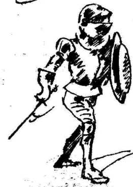
Ἡ νύκτα τοῦ δρατῶν