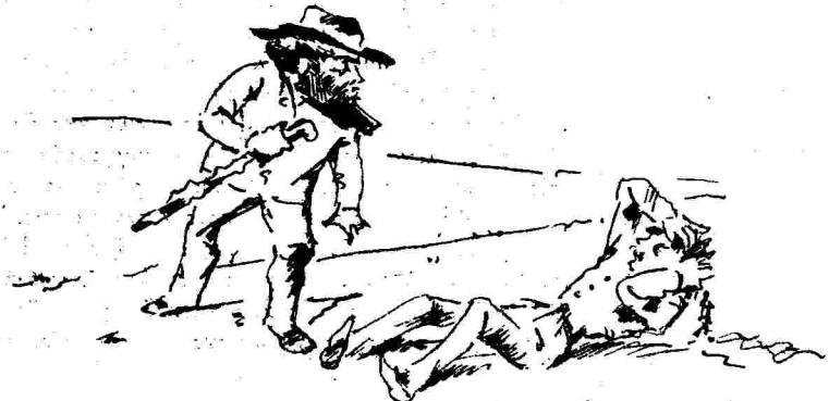
Ἐνώπιον 4,000 δρατῶν