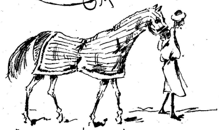
Ὁ γροσσι τοῦ Μουρῆ ἔφηνε