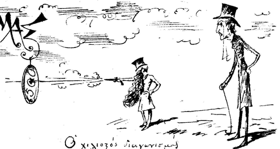
Ο χιλιοζός διαγωνισμός