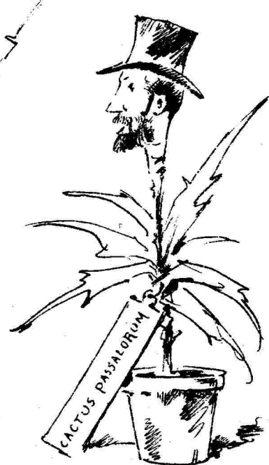
Διά τιν' ἰνδίων τοῦ ἀνδῶνος τοῦ κ. Τριούπη