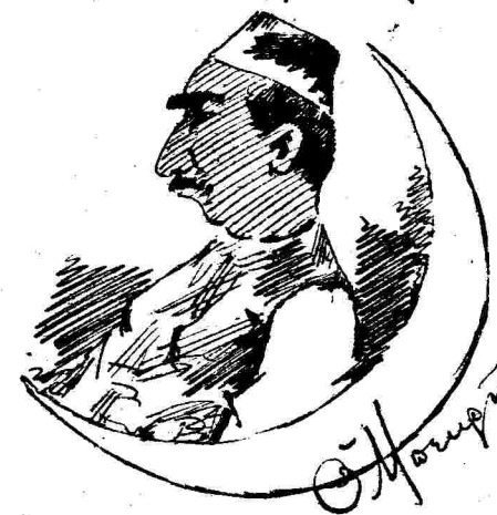
Ὁ Μουρῆ ἔφηνε