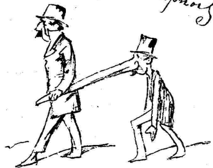
Μαυρατά τῆς ὥρας

Τὸ ζῆλον - Μορναχί, τὰ ἱστορικὰ μάρτυρα! - Νὰ δᾶ ἡ ὥρα!