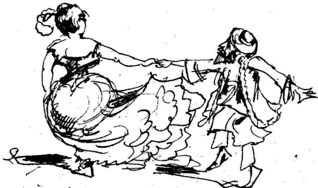
Μεφόρμα - παρομοίαι.