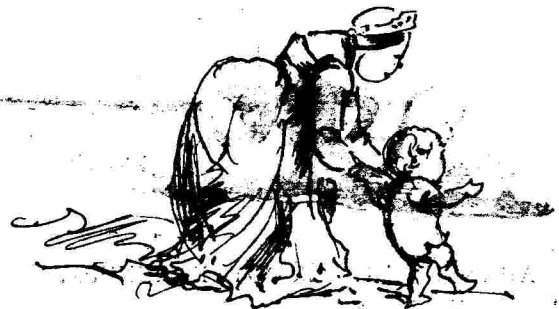
Ἐσαγωγή τροφῆς ρωστικῶν χέρων μεφόρμας