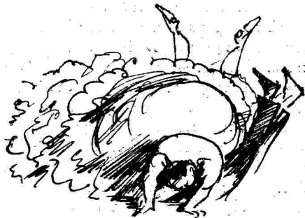
Τὸ τραγικὸν μέρος