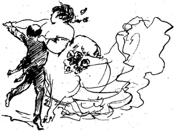
Τὸ διασκευαστικὸν μέρος