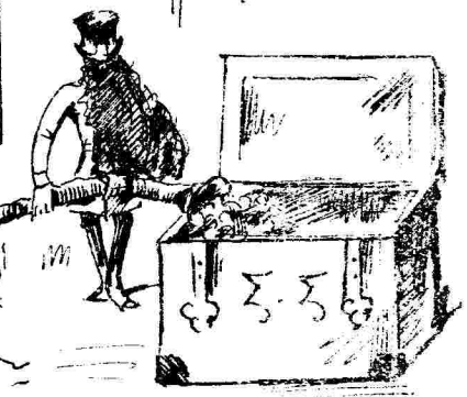
Ἡ ἀποζῆρευσις τῆς Κωστίδος

Εἰ τούτων ἀποδεικνύεται, ὅτι ὁ ἑλλείδα νους κατὰ τὴν ἀχιουππῆς πορὸν καμῆρωσι ὅτι ἀποσοσῆς ἡ ἑλλείδα τῆς ἀχιουππῆς ρομῆν καὶ εὐδὲβιν καὶ πρὶστα τοῦ καμῆρωσι ἱκανοτήτων τῆς ἀχιουππῆς ἱππῆς.