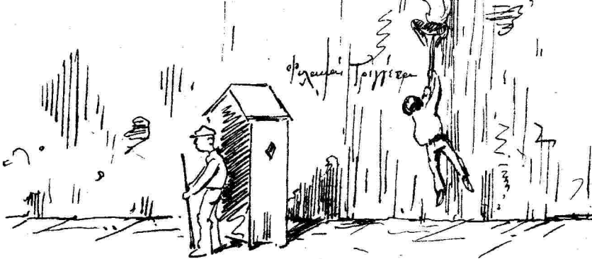
Ὁ γυμνασιάρχης τῆς βίρας