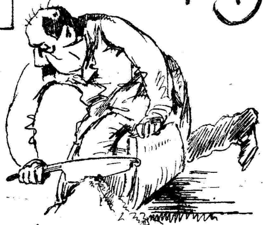
Ὁ ναυαγιστὴς τῆς βίρας