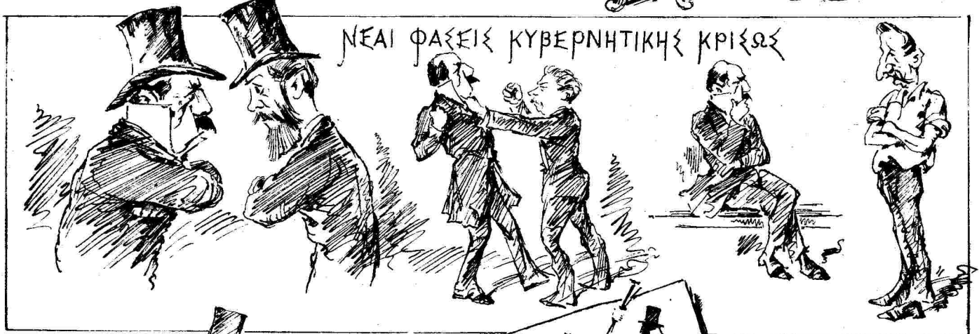
ΝΕΑΙ ΦΑΣΕΙΣ ΚΥΒΕΡΝΗΤΙΚΗΣ ΚΡΙΣΟΣ