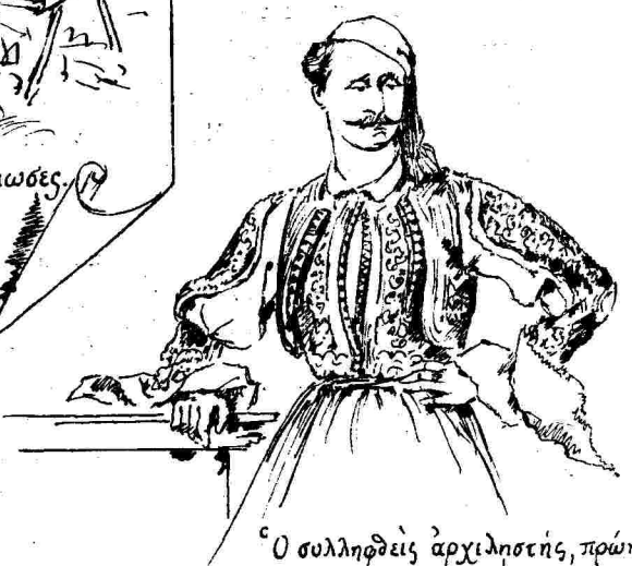
Ὁ συλληφθεὶς ἀρχιλοσιπὴς, πρῶτον ἐπιστάλης τῶν φυλακῶν, καὶ modello τῶν φωτογράφων.