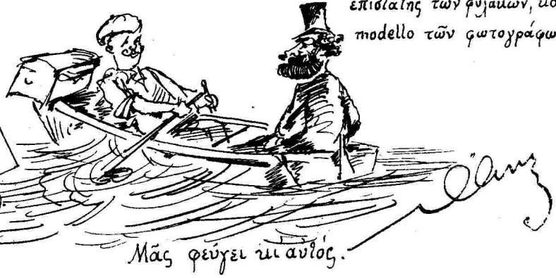
Μᾶς φεύγει τὸ αὐτὸς.