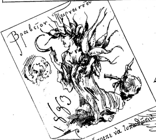
Πᾶς ἔπρεπε νὰ ἱσπαδιάσῃ.