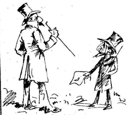
- Δὲν ὄχω ἀνάγκη, ἔχω τὴν ἄδειά μου - Αἱ περιστάσεις, οὐκ ὀκί μόνον αἱ περιστάσεις ἀλλὰ καὶ...