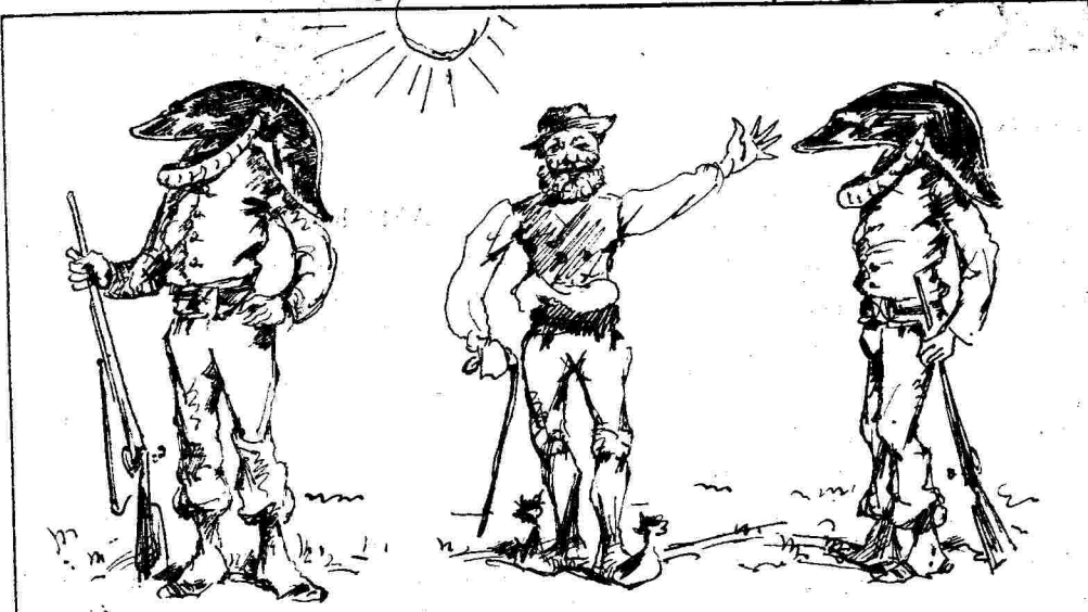
Με τὸ κράνος βαρὺ ἐστὸ σποτάδι