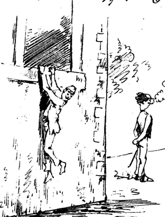
Ρεβασοὶς ἀγρινοῦ καὶ ζωοδόχου κοτόπου

-Τί, τίς γιατρί εἶνε φόβος γιά ἕγγρα ἀπὲς τὴν Βουλὴν; -Περί ἕγγρας καὶ θαρροῦ δὲ γράφει σπουδαστὴς