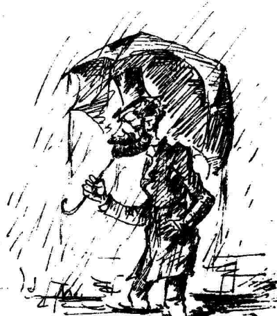
Διὰ τὴν θλίψιν