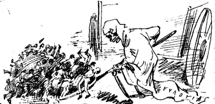
Ποδ δὲ φέρειεν