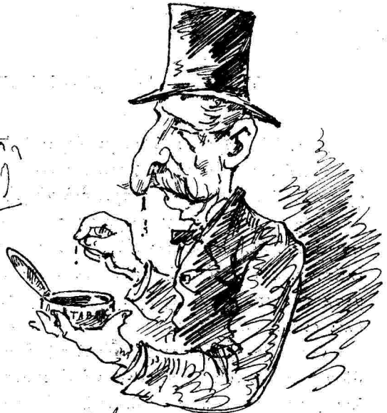
Διὰ τὸ πῶρον ὁ νεανὸς;