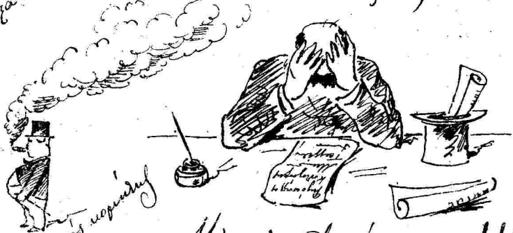
Μὴ γιὰ τὸν Δεβίς πῶρον!!!