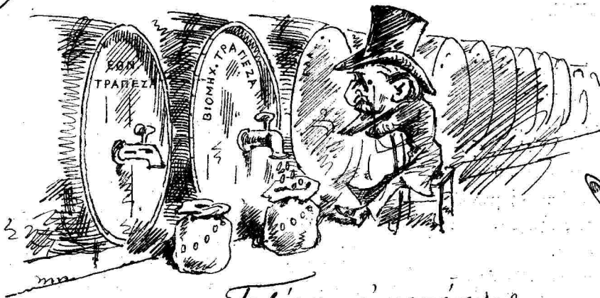
Τα βίρα εισαγομένης