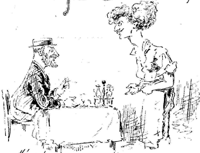
Μία τσίχα. Μυζήρι εδάσεια! Αμ' ήτοι ού αμύρι ε' ίνι πούσι!