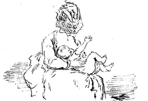
Αντιομδιρ η' η' πρσορράμπαρι