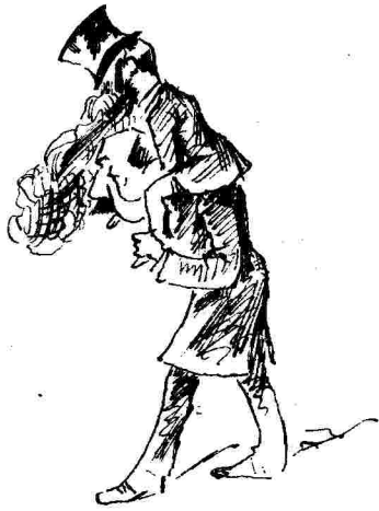
Τράχηλος Ἕλληνας ζυγὸν δὲν ὑποφέρει.