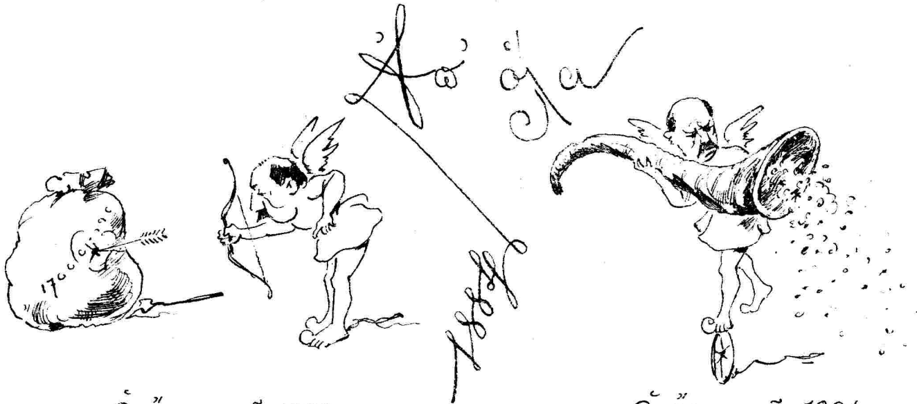
Ὁ ἔρως τοῦ 1883.